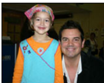
Charles Lafortune Gregory pour la vie

Le 16 novembre se déroulera le Radiothon de la Fondation de l'Hôpital Sainte-Justine. De 6h à 19h, les stations du groupe Corus - Info 690, 98,5, CKOI 96,9, CKAC, Q92 et 940 Montréal - diffuseront leurs émissions en direct du hall de l'hôpital, qui sera également transformé en scène. On y attend divers artistes et invités-surprise, dont Vincent Vallières ainsi que Gregory Charles et sa chorale. Parrainé par Charles Lafortune , le radiothon servira à recueillir des fonds pour les petits mousses qui fréquentent ou habitent tristement les lieux.